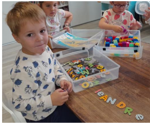
Reconstituer son prénom.