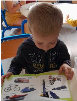
Regarder des livres.