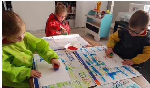
Les PS2 réalisent un cadre pour la photo de leur doudou.