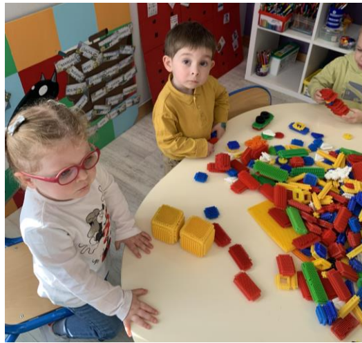
Les MS font des réussites.