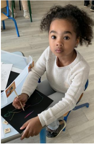
Dessiner un bonhomme sur une carte à gratter.