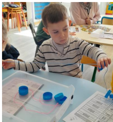
Passer un fil dans les bouchons.