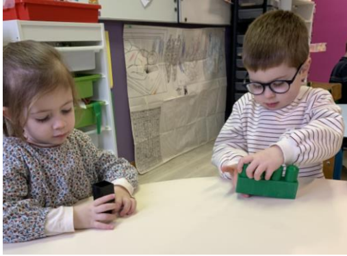
Les MS jouent au jeu du détective.