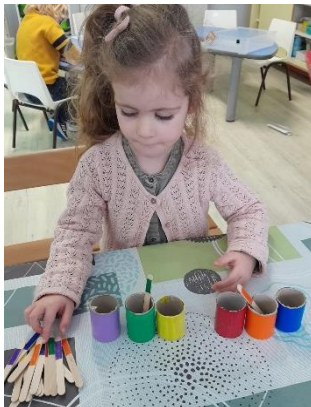
Les enfants découvrent les nouveaux ateliers de la période.