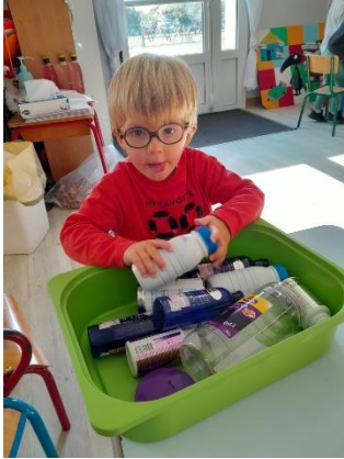
Visser et dévisser