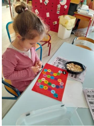
associer deux lettres identiques.