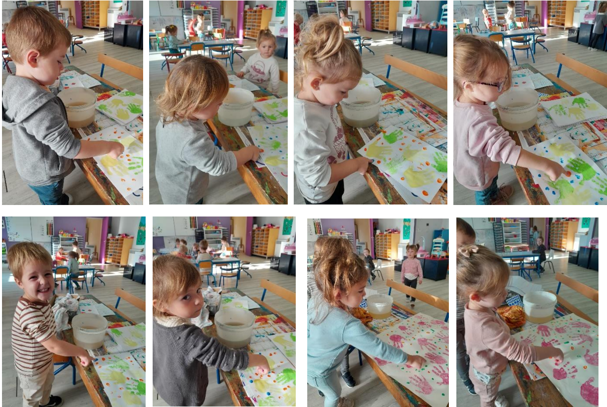
Les MS ont raclé un mélange de colle et d'encre, sur leurs lignes verticales.