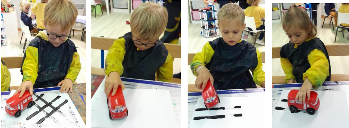
Les PS s'entraînent au graphisme sur des pistes.