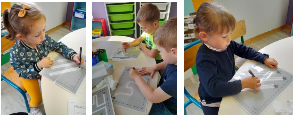
Les MS tracent de nouveau de belles lignes verticales avec les crayons rocks.