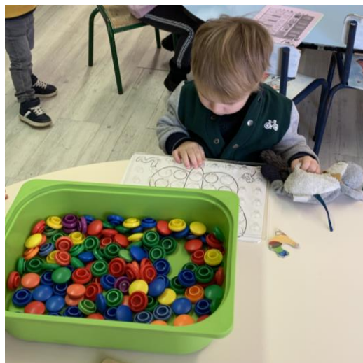
Remplir la grille avec les jetons.