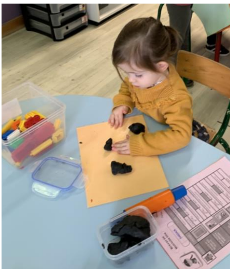
Étaler la pâte à modeler