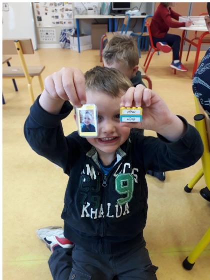
Retrouver son prénom (pS)