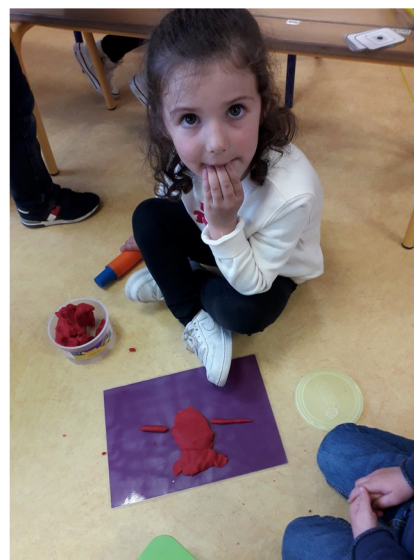
Réaliser un bonhomme en pâte à modeler (PS)