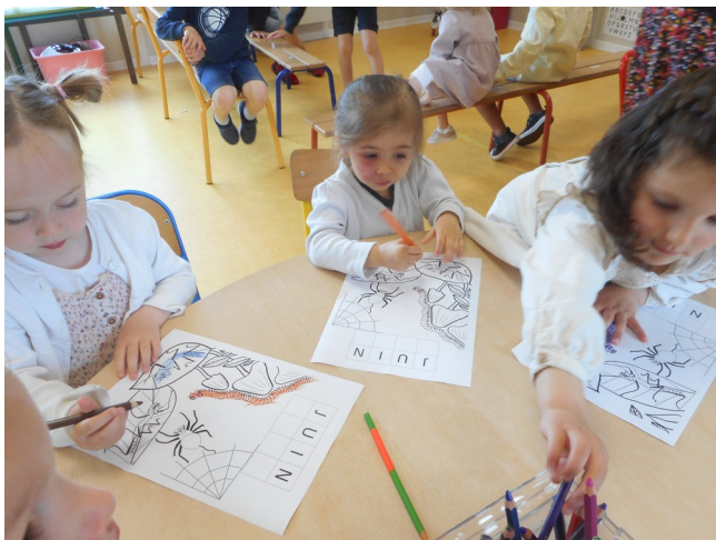
Les enfants de la classe ont colorié la fiche du mois de juin.