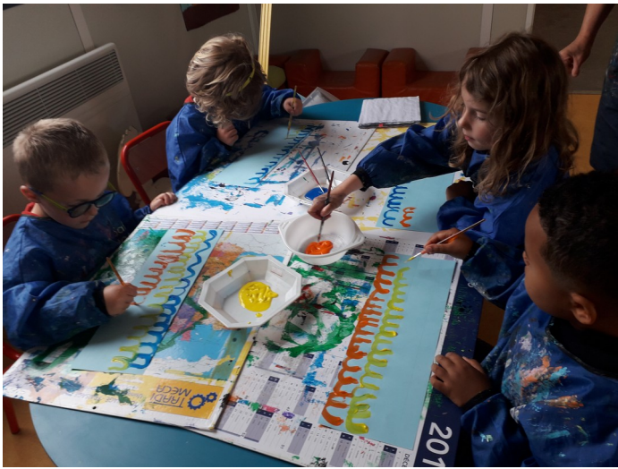
Les MS ont tracé des ponts à la peinture puis au feutre.