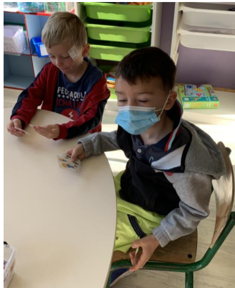
Jouer à la bataille.