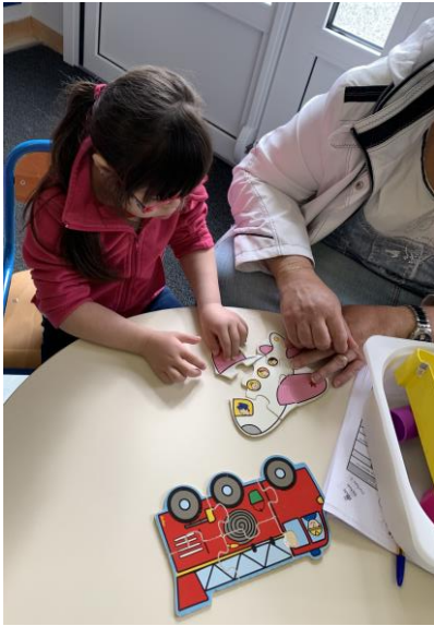
Réaliser des puzzles.