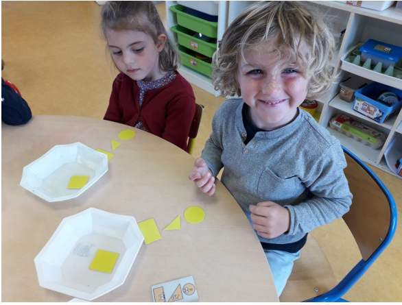
Après avoir nommé les formes, les MS ont joué au jeu du portrait en reproduisant une configuration géométrique.