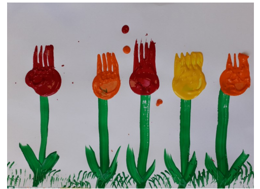
Les PS ont réalisé de jolies tulipes en peinture en utilisant notamment une fourchette.