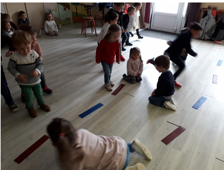
Dans la cour ou en salle, cette semaine les enfants ont joué à la rivière aux crocodiles.