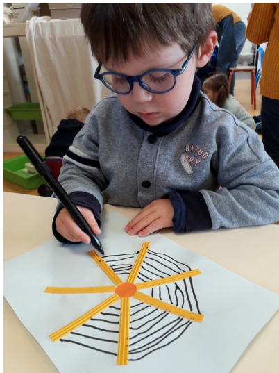
Ils se sont aussi entraînés à tracer des lignes horizontales.