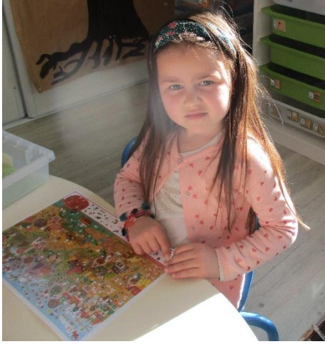
Trouver des détails sur une image.