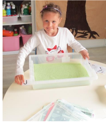
Tracer des lettres dans le sable.