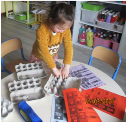
Mémoriser des quantités de 9 à 12 éléments.