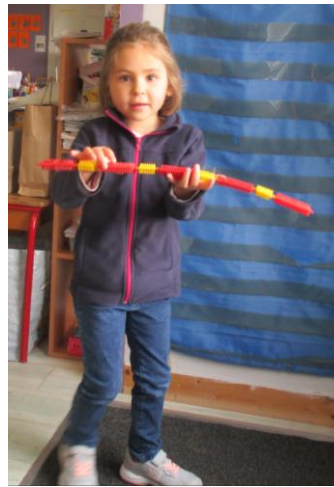
Produire un algorithme.