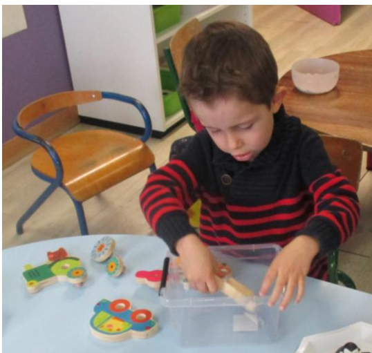
Visser et dévisser.