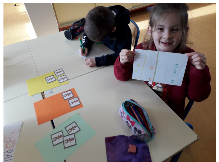
Les GS ont réparti des petits bébés dans trois chambres différentes, ils ont pris conscience qu'il y avait plusieurs solutions. Ils ont également symbolisé leur résultat.