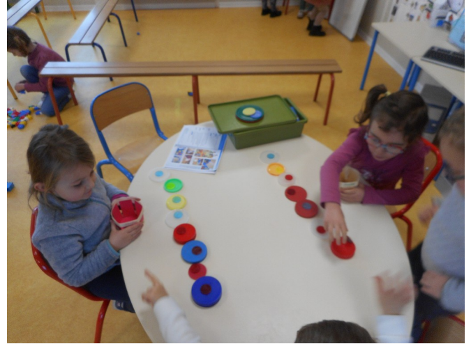
Les MS ont réalisé des collections ayant le même nombre d'objets qu'une autre.