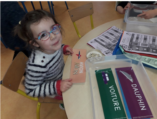
Reconstituer des mots en capitales (MS)