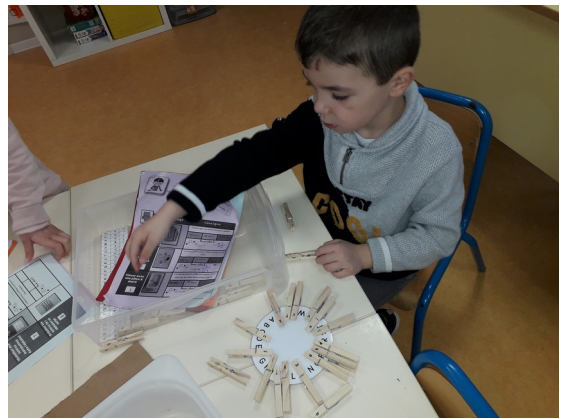
Associer lettres capitales et lettres scriptes (GS)