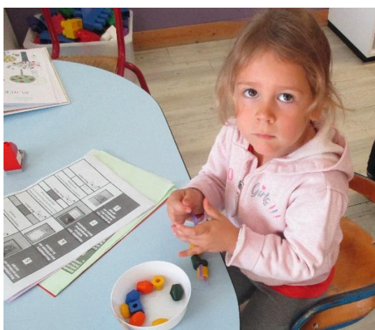
Coller des gommettes sur une ligne. Enfiler des perles sur un support flexible.