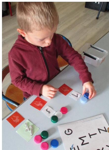
Associer une collection et une constellation.