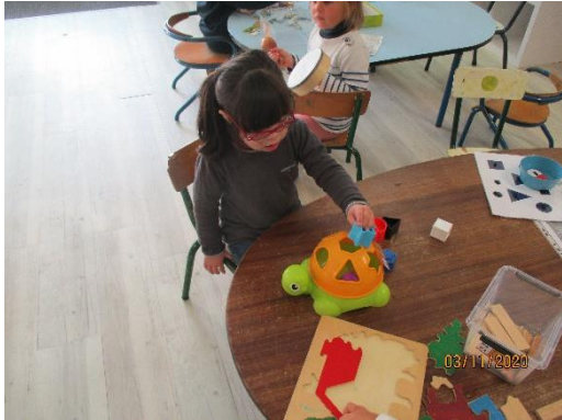
Encastrer des formes dans une boîte.

Cette semaine, nous découvrons les nouveaux ateliers de cette période.