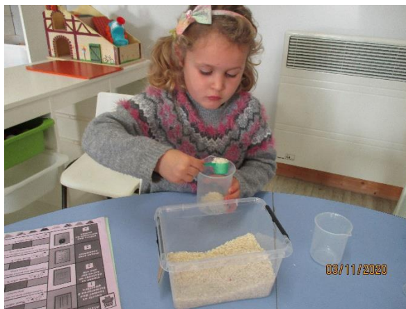
Associer des prénoms identiques en capitale. Transvaser en respectant une limite.