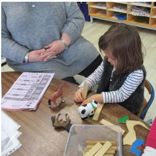
Représenter des lignes verticales.