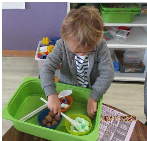
Tourner pour mélanger.