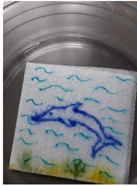
Et voilà !