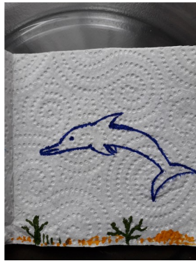
Dessin à l'intérieur